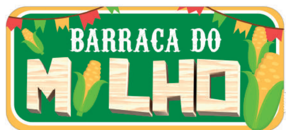
Placa de Identificação para Milho