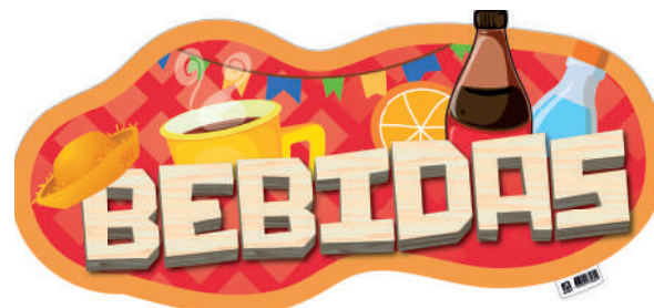
Placa de Identificação para Bebidas