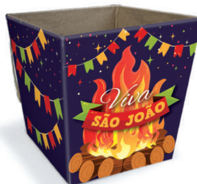
Cachepô P - Fogueira