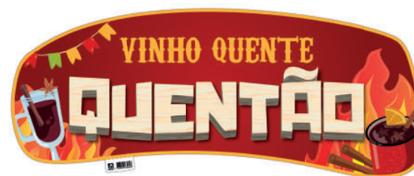
Placa de Identificação para Quentão