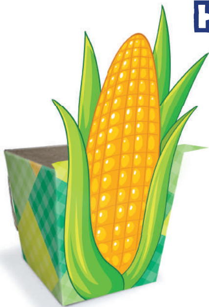
Cachepô Milho Verde