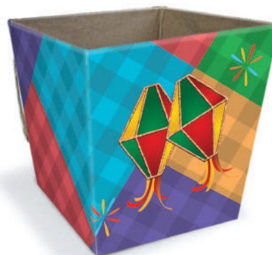
Cachepô P - Balão