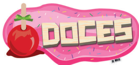
Placa de Identificação para Doces