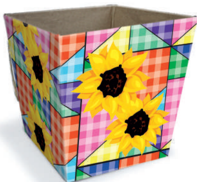
Cachepô P - Girassol