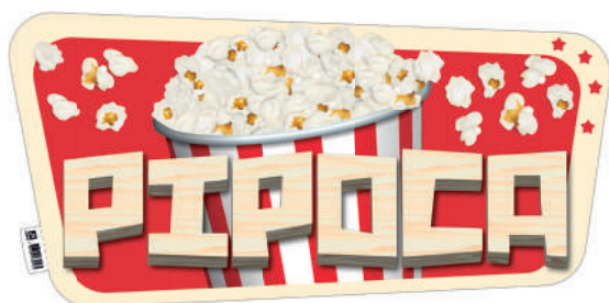
Placa de Identificação para Pipoca