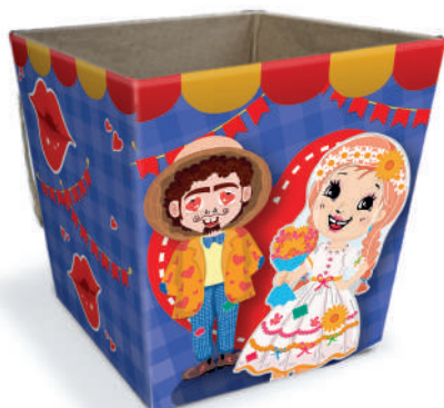
Cachepô P - Noivos Caipiras