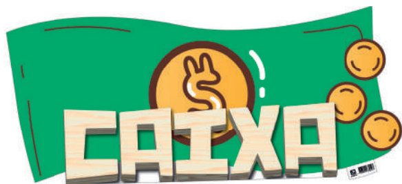
Placa de Identificação para Caixa